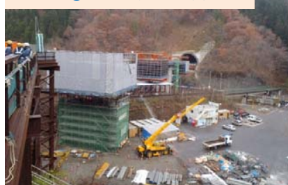
施工：⑧三井住友・日本国土JV