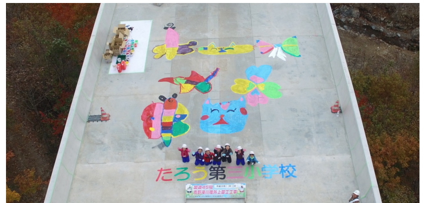
描いた絵と一緒に集合記念写真