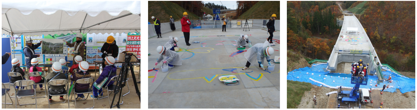
橋の作り方を写真で学びました 完成した橋の上に絵を描きました 高所作業車に体験乗車し橋と描いた絵を眺めました

田老第3小学校の1・2年生7名が「青の滝川橋(橋長：101m)」の現場を見学しました。出来上がった橋を見ると大きな歓声があがりました。