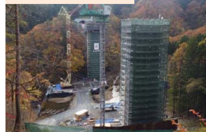
施工：⑪ピーエス三菱