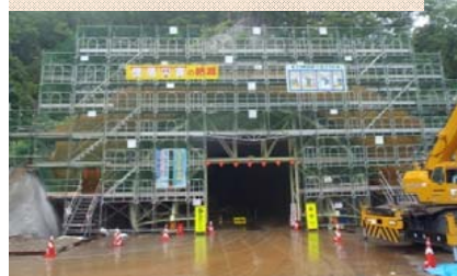
施工：⑥三井住友・日本国土JV