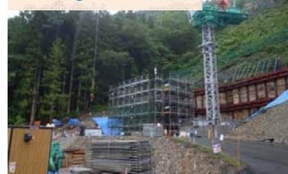
施工：⑨ピーエス三菱