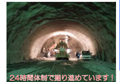
24時間体制で掘り進めています！