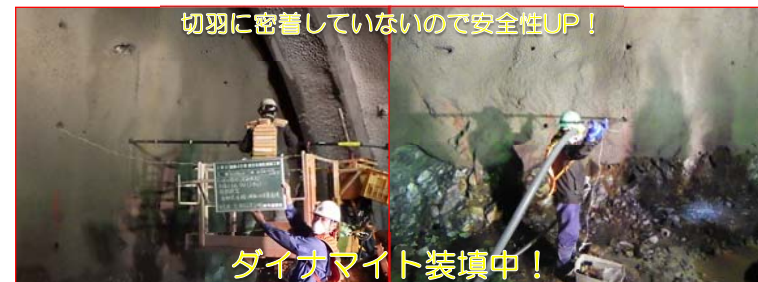
切羽に密着していないので安全性UP！