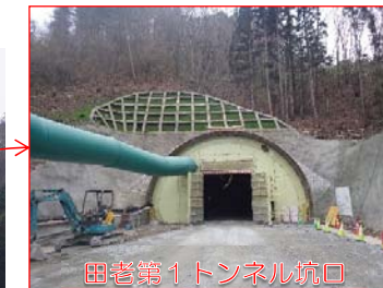
田老第1トンネル坑口