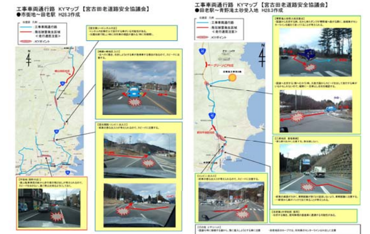
↑ KY(危険予知)マップ ↑ 地元の皆様から頂いたご意見や運転手の意見を参考に作成しました。