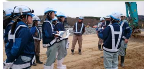
現場でヒアリング！