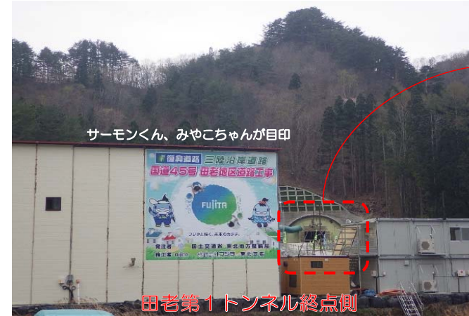
サーモンくん、みやこちゃんが目印

本工事は、宮古老道路のうち田老地区において、田老第1トンネル(延長455m)、田老第2トンネル(延長674m)、田の沢川橋下部工及び道路の新設工事です。