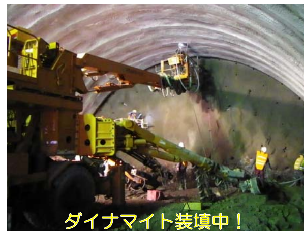
ダイナマイト装填中！

トンネル工事では、ダイナマイトによって山を爆破して掘削を行う方法があります。一般的にダイナマイトの装填は切羽(きりは：トンネルの先端)に密着した作業となるため、落石などによる危険を伴います。この爆薬遠隔装填システムでは、切羽から約2m離れた位置からの遠隔装填が可能となり安全性が向上します。