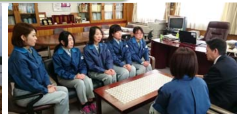
三陸国道事務所長に報告