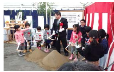
鎮入れの儀(崎山保育園と一緒に)