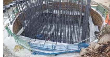
施工：⑧ピーエス三菱