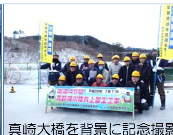
真崎大橋を背景に記念撮影