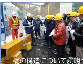
橋の構造について説明