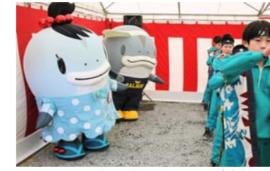
サーモンくんとみやこちゃんも応援に!