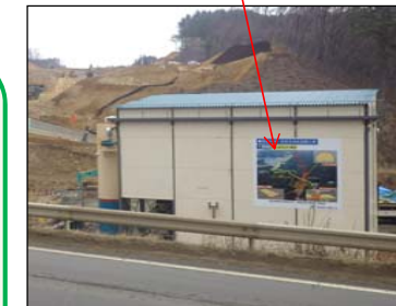
国道沿いで工事をしています

当工事は、新田平地区の国道の両側で工事を行っています。トンネル工事はこれからが最盛期となりますので品質の良い物を安全に造っていきます。地元や近隣の方々にはご協力をいただきながら、1日も早い復興道路の開通を目指し、『安全最優先』で施工しておりますので今後ご理解、協力の程よろしくお願いいたします。