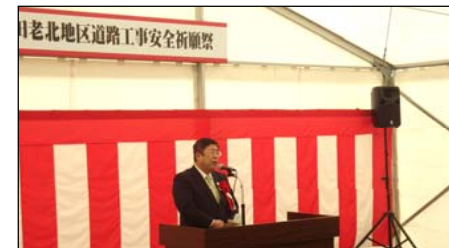
宮古市長あいさつ