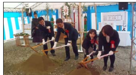
鎮入れの儀 (田老保育園と一緒に)