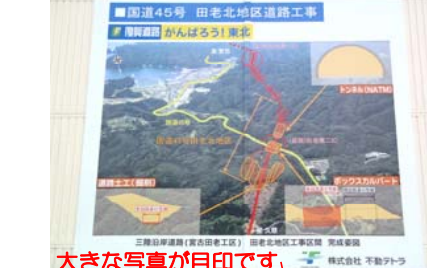
大きな写真が目印です