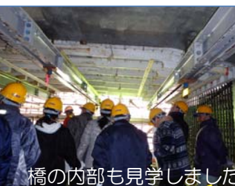
橋の内部も見学しました