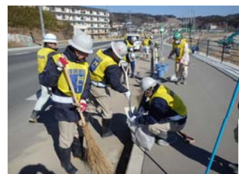
↑道路脇の土砂を除去

協議会メンバー約30名で、小林地区周辺(バス小林停留所～田老橋付近)の国道沿いの清掃を行いました。