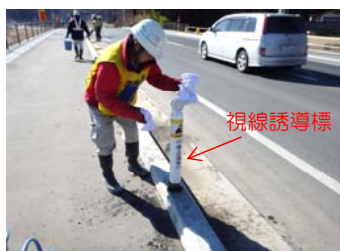
↑ホコリを被った視線誘導標を水拭き