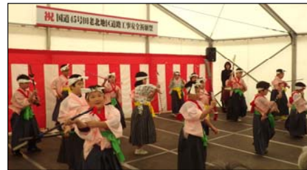
田老第一小学校児童による“末前神楽七つ物”