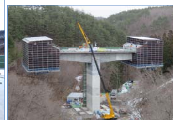
真崎大橋から見た青野滝川橋