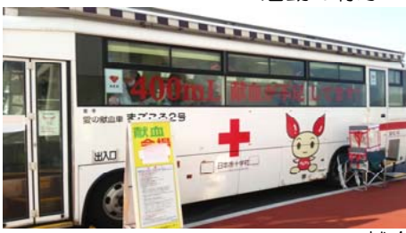
献血バス「まごころ号」 この中で献血します