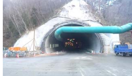
施工：⑤三井住友・日本国土JV

椋内第2トンネル終点側坑口です。現在、起点側468m 終点側585m掘り進みました。