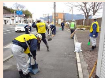
H27.12 市役所前国道清掃