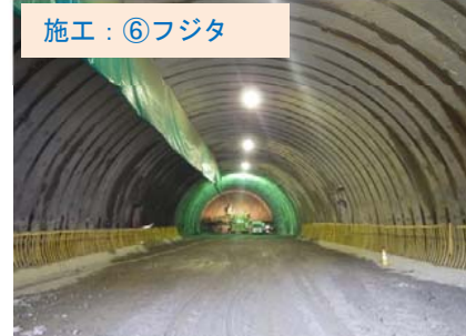
施工：⑥フジタ 田老第1トンネル内部の状況です。現在、93m の進捗です。