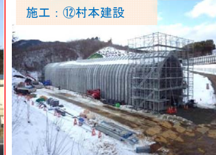
施工：⑫村本建設 “アーチカルバート”の据付が完了しました。