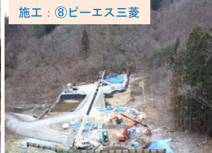
施工：⑧ピーエス三菱 現場の全景写真です。1/24に現場見学会を開催しました。