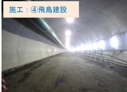
施工：④飛鳥建設 山口第2トンネル終点側の状況です。現在、起点側516m 終点側1,234m の進捗です。