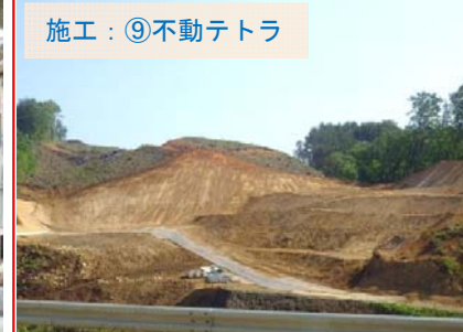
施工：⑨不動テトラ 【H27.6】新田平地区の状況です。