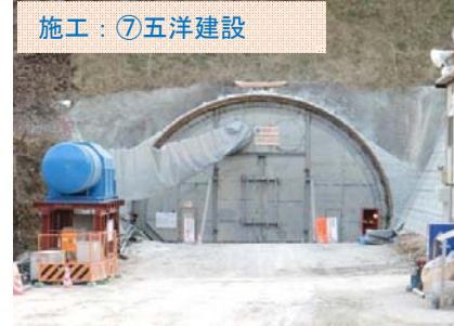
施工：⑦五洋建設 田老第3トンネル終点側の坑口です。防音壁を設置しています。現在、104m の進捗です。