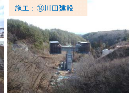
施工：⑭川田建設 国道45号真崎大橋から青野滝川橋を見えています。