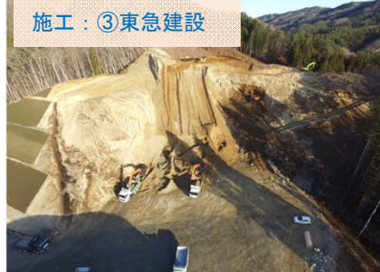
施工：③東急建設 山口地区の状況をドローンで撮影しました。引き続き、土を搬出しています。