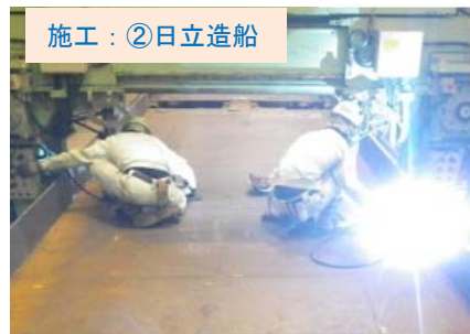
施工：②日立造船 工場で橋桁(はしげた)の製作を行っています。