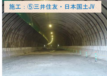
施工：⑤三井住友・日本国土JV 椋内第2トンネル起点側の状況です。現在、起点側380m 終点側503m の進捗です。