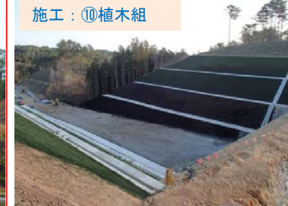
施工：⑩植木組 工事の、最後の仕上げを行っています。