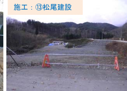
施工：⑬松尾建設 重津部地区の状況です。まもなく工事が始まります。