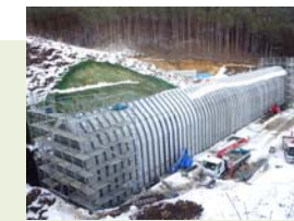
1月中旬に据付完了しました

この工法は、壁を2分割にした製品と現場打ちコンクリートを合わせてアーチカルバートを施工するというものです。