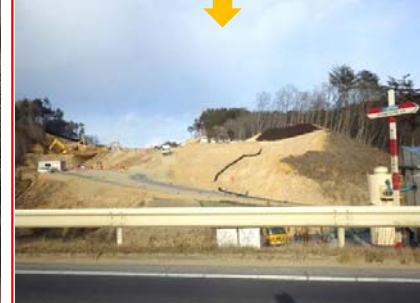
【現在】山を掘削する工事がここまで進みました。