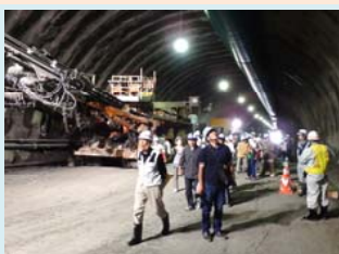
H27.6 山口第2トンネル 地元見学会