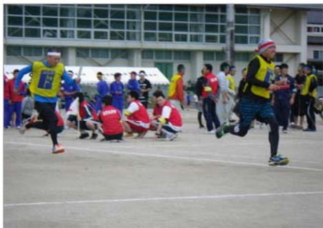
「男女混合対抗リレー」 一所懸命走りました！