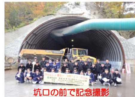
坑口の前で記念撮影

10月29日に厨川中学校の皆さんが、総合学習及び復興教育の一環として椗内地区トンネル工事の椗内第2トンネルの現場を見学しました。 2学年31名の皆さんが復興工事の概要やトンネルの作り方など、沢山のことを学びました。