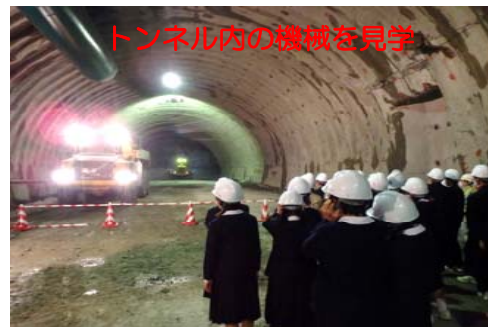
トンネル内の機械を見学