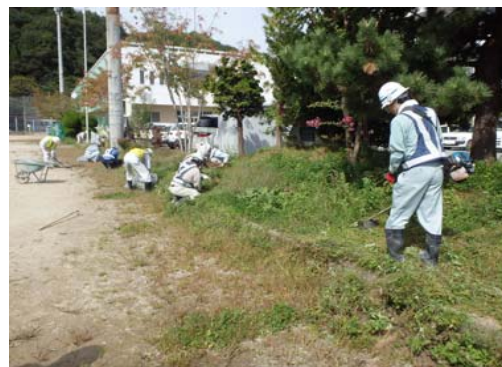
大会前には会場(田老第一中グラウンド)の草刈りと整地を行いました

また、主催者様のご厚意で、宮古田老道路を紹介するパネルブースを設置させていただきました。沢山の方に見ていただいたり、ご意見を頂戴することができ、大変有意義なものとなりました。 地元の方達との交流によって、早期復興への想いを新たにいたしました。