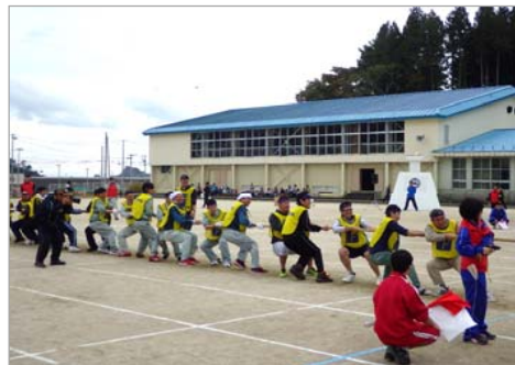
「綱引き」 協議会チームは、1勝1敗でした