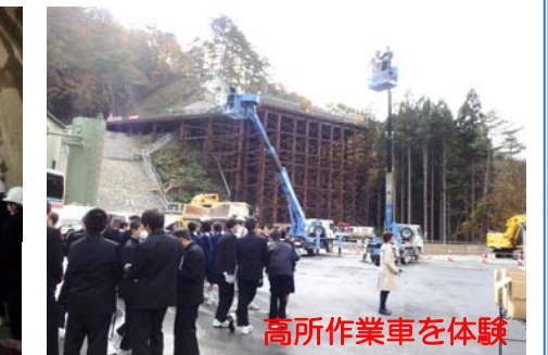
高所作業車を体験