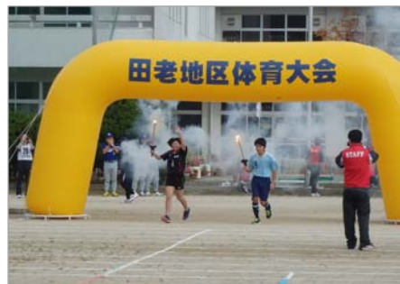
開会式の様子 (炬火の入場)

10月11日(日)に、第69回田老地区体育大会が開催されました。当協議会メンバーも競技者として、大会に参加させていただきました。 田老地区の皆さまをはじめ、宮古市の姉妹都市でもある八幡平市や青森県黒石市の方々、他の復興工事関係者も多数参加し、様々な競技を通して交流を深めました。