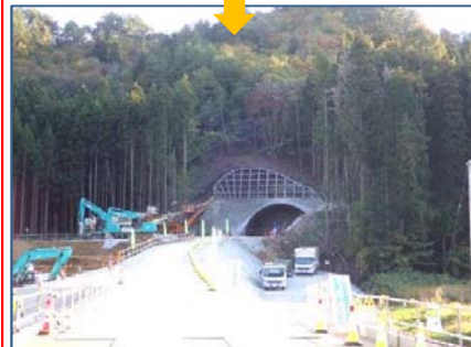
施工：⑧ピーエス三菱

大きなダンプで岩を運んでいます。現在、起点側196m 終点側355m の進捗です。