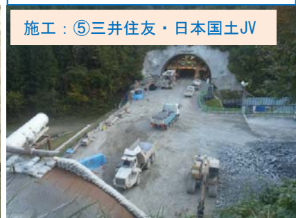
施工：⑤三井住友・日本国土JV

大きなダンプで岩を運んでいます。現在、起点側196m 終点側355m の進捗です。