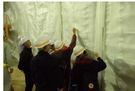
防水シートにメッセージを いただきました