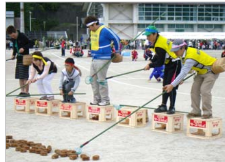
「田老名物レース」 ウニ(実際はタワシ)を、網ですくいます