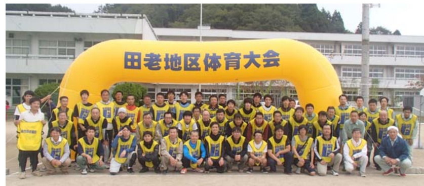
今後も皆様と共に、復興工事を進めて参りたいと思っております どうもありがとうございました！！