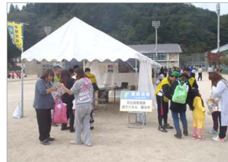
宮古田老道路紹介ブース 沢山の方にお越し頂きました！

また、主催者様のご厚意で、宮古田老道路を紹介するパネルブースを設置させていただきました。沢山の方に見ていただいたり、ご意見を頂戴することができ、大変有意義なものとなりました。 地元の方達との交流によって、早期復興への想いを新たにいたしました。