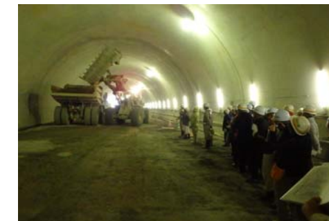
トンネル重機の実演