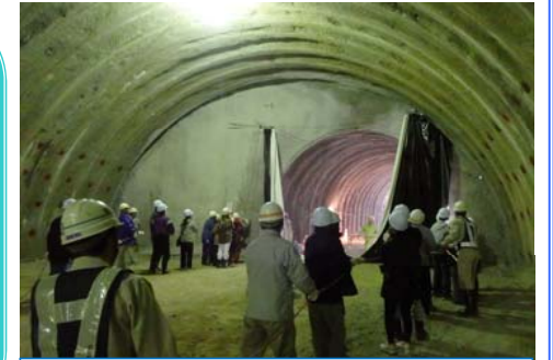
暗幕を引いて無事貫通！

田老第4トンネルの貫通により、宮古田老道路では13本中、3本のトンネルが貫通しました。