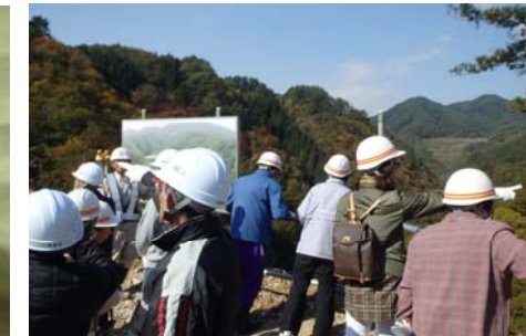
到達側からは綺麗な紅葉が 見渡せました！