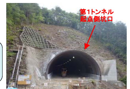
第1トンネル 起点側坑口