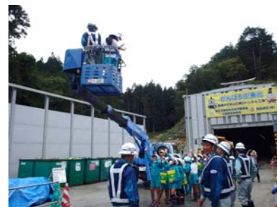
高所作業車を体験