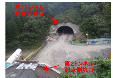
第2トンネル 起点側坑口