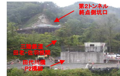
第2トンネル 終点側坑口