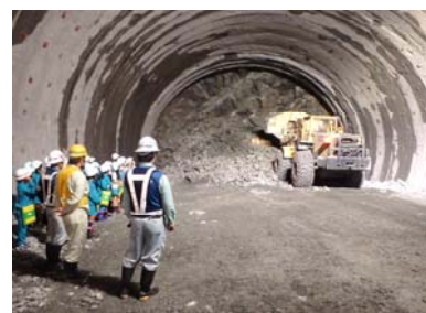
重機の実演(迫力満点でした！)

9月25日(金)に、宮古市立崎山小学校の5年生(25名、教員2名)の皆さんが「宮古市の復興について理解や関心を深める場」として、山口第2トンネルを見学されました。