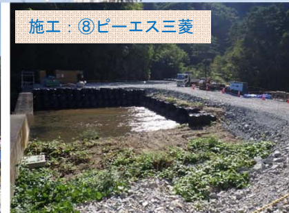
施工：⑧ピーエス三菱