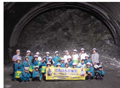
トンネル内で記念撮影

9月25日(金)に、宮古市立崎山小学校の5年生(25名、教員2名)の皆さんが「宮古市の復興について理解や関心を深める場」として、山口第2トンネルを見学されました。