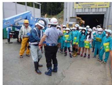
先生も高所作業車を体験しました！