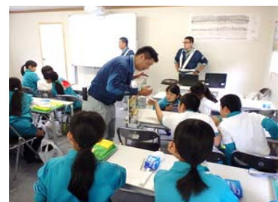
ダイナマイトの模型を説明