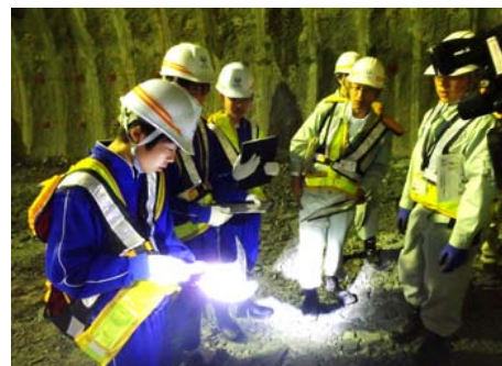
トンネル内で岩の硬さを確認しました