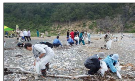
プラスチック片や缶やペットボトルが散乱していました