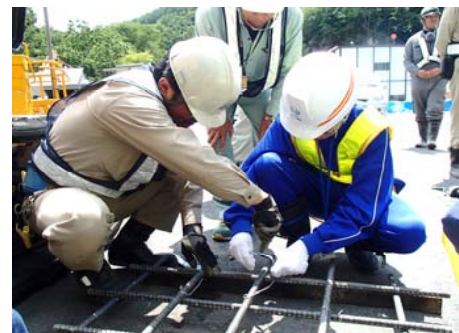
鉄筋の組立を体験しました “ハッカー”という道具を使用します