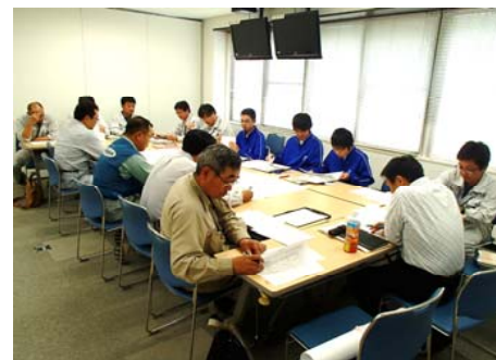
各工事の工程調整会議にも出席しました