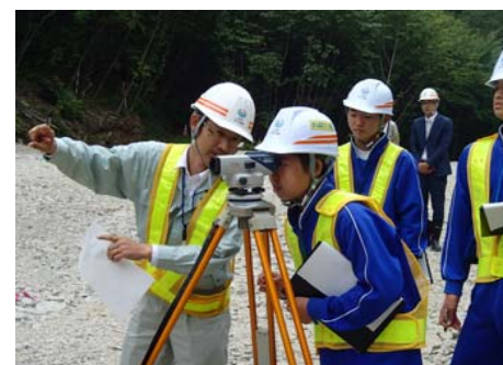
地盤の高さを測定しました