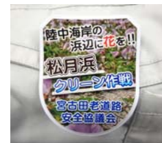
皆でワッペンをつけて参加しました！

活動の様子は、浄土ヶ浜ビジターセンターのブログでも見ることが出来ます。ぜひご確認ください。アドレス→http://jodogahama-vc.jp/