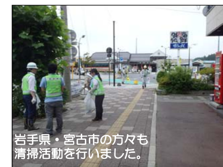
岩手県・宮古市の方々も清掃活動を行いました。