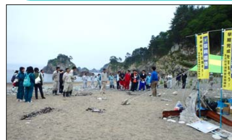
主催者より松月浜の保全について、お話を聞きました