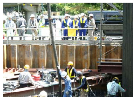
実際の打設作業を見学しました