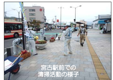
宮古駅前での清掃活動の様子