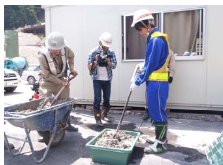
生コンクリートの打設作業を体験しました