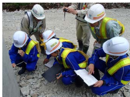
出来上がった橋脚の幅を測定しました