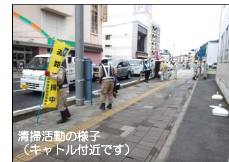
清掃活動の様子 (キャトル付近です)