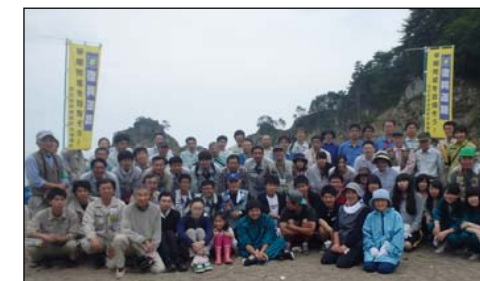
最後に集合写真を撮影しました