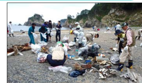
集まったゴミはみんなで協力して分別しました