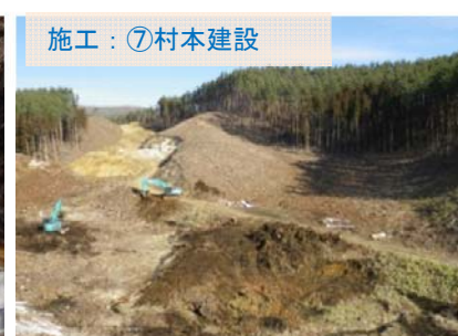
施工：⑦村本建設 伐採作業で残った、根っこを取り除いています。