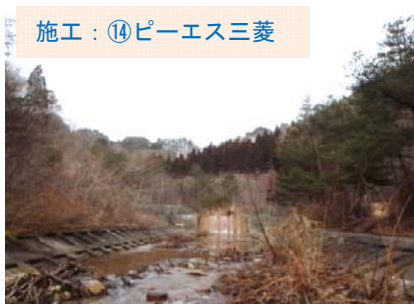
施工：⑭ピーエス三菱 これから、長内川（おさないがわ）に橋をかける工事が始まります。