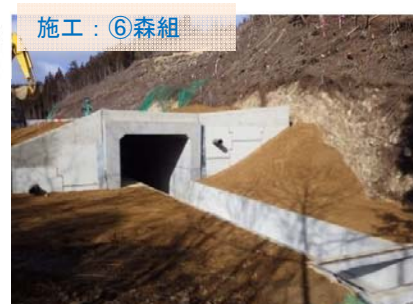
施工：⑥森組 水路になるボックスカルバートの設置が完了し、これからまわりに土を盛ります。