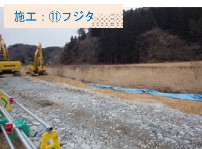
施工：⑪フジタ 川の対岸へ渡るための、仮橋の工事が始まりました。

その他 施工： ⑧浅沼組： 引き続き、国道沿いの山をけずっています。 ⑬不動テトラ： 現在、工事着手に向け準備中です。 新たに、 ⑮国道45号 青野滝川橋外上部工工事 ：川田建設 が契約となりました。