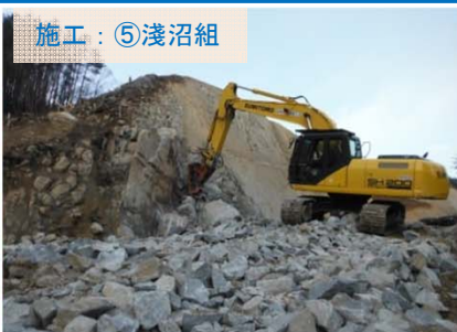
施工：⑤浅沼組 かたい岩を、“ブレーカ”という機械を使って壊しています。