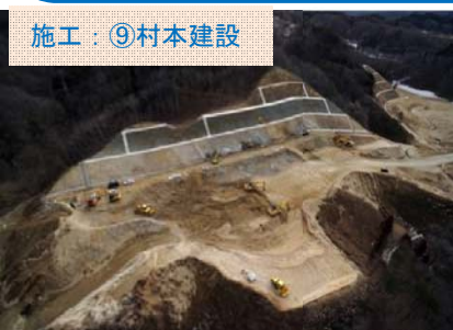
施工：⑨村本建設 空から現場全体を見えています。引き続き、土を搬出しています。

平成27年2月28日現在、14箇所にて工事が行われています。(準備中も含む) また、新たに1箇所の工事が契約となり、全部で15箇所で行われます。