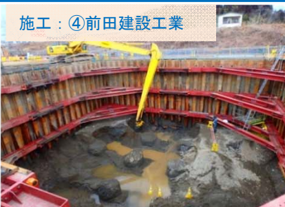
施工：④前田建設工業 橋を地中で支える基礎（フーチング）になる部分を掘っています。