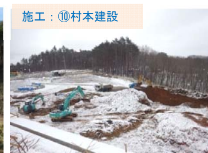
施工：⑩村本建設 引き続き土を搬出したり、雨水などを排水するための側溝（そっこう）を設置しています。