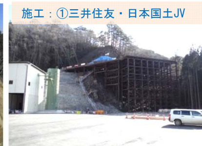
施工：①三井住友・日本国土JV 高い場所に、鉄骨で作業スペースをつくりました。この場所からトンネルを掘る準備をしています。

その他 施工： ⑧浅沼組： 引き続き、国道沿いの山をけずっています。 ⑬不動テトラ： 現在、工事着手に向け準備中です。 新たに、 ⑮国道45号 青野滝川橋外上部工工事 ：川田建設 が契約となりました。