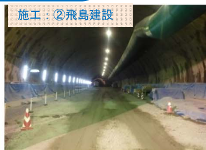
施工：②飛鳥建設 終点側入口からトンネルを見えています。約240m進みました。起点側では約76m掘り進んでいます。