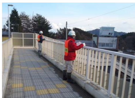
監視状況です(1台1台、直接目でみて確認します)