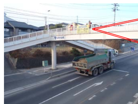
今後も、様々な場所で実施します(写真は、佐原地区で実施した時の様子)