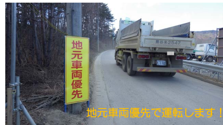
地元車両優先で運転します！

今後も、復興道路の早期完成を地域のみなさまとともに進めていきたいと思っておりますので、工事へのご理解とご協力をいただきますようお願いいたします。