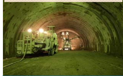
施工：②三井住友・日本国土JV