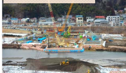
施工：⑤前田建設工業

引き続き、橋を地中で支える基礎杭を作っています。たくさんのクレーンが動いています。