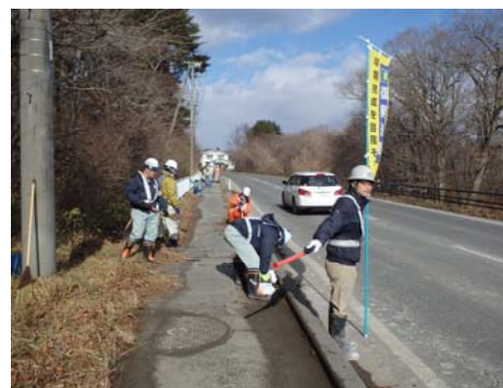
安全に気をつけて作業しました(大変おつかれさまでした)