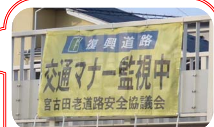
この横断幕が目印です！！

ご意見・ご感想をお寄せ下さい。また、工事見学のご希望がありましたら、下記に記載のURLから工事見学の募集を承っています。ホームページ URL: http://www.thr.mlit.go.jp/sanriku/index.html