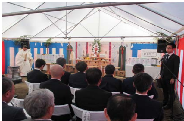
安全祈願祭には、合わせて約100名が出席しました