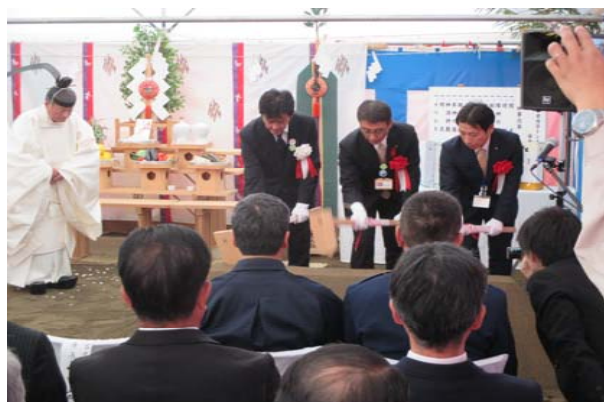
関係機関の出席者代表による鍬入れ