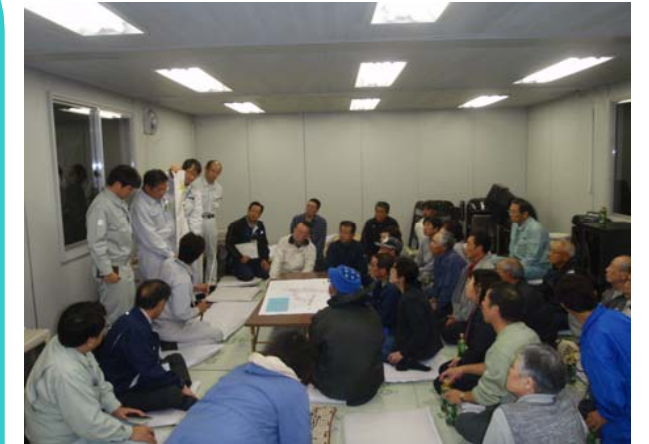
地元説明会の様子

10月17日(金)に田老の大平地区(小林地区)において、田老第1インターチェンジの工事についての地元説明会が開催されました。今後、大平地区(小林地区)で本格的に工事が始まるのを期に、これからどのように工事が進むかの説明を行いました。まずは水路ボックスの設置、その後の道路の迂回、トンネル工事についての説明や近くを流れる神田川に架かる橋についてなど・・・、熱心に説明を聞いていただきました。お忙しい中、26名の方にお集まりいただき、説明会の最後には地元の皆様から質問や要望をいただくなど、大変有意義な会となりました。多くの皆様のご協力のもと、工事に着手することができました。今後も、地元地域への配慮を十分に行いながら、工事を進めてまいります。なにとぞ、ご理解ご協力をお願いいたします。