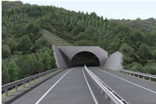
田老第4トンネル南側(宮古側)完成予想図