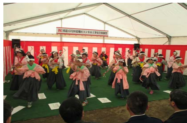
田老第一小学校の児童による「末前神楽七つ物」