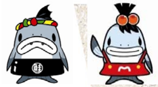
サーモンくん みやこちゃん