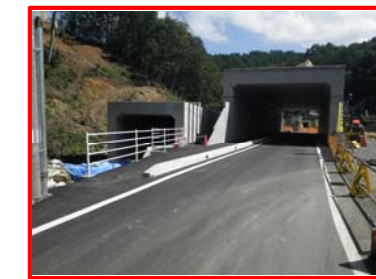
▲市道箱石線、準用河川女遊戸川供用状況