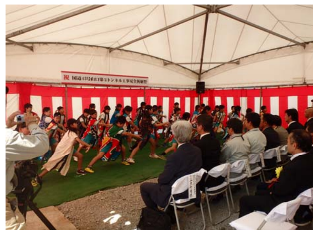
崎山小学校の児童によるよさこいさんの披露