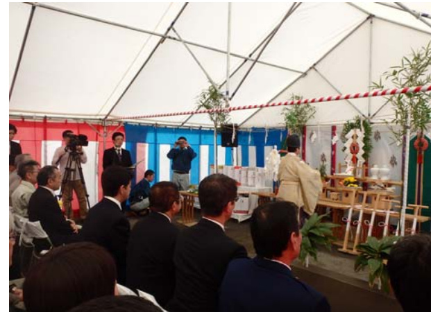
安全祈願祭の様様