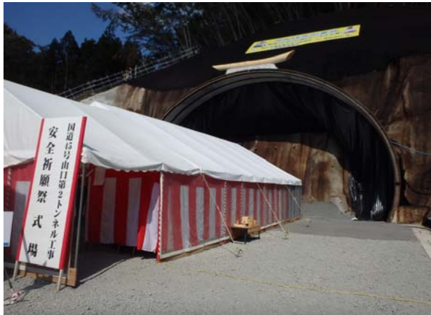
山口第2トンネル南側坑口