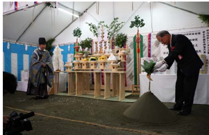
山口副市長による鍬入れ