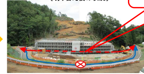
市道の切り替え後は、ボックスカルバートの中を通行します。(現在の迂回路は通行できません。)