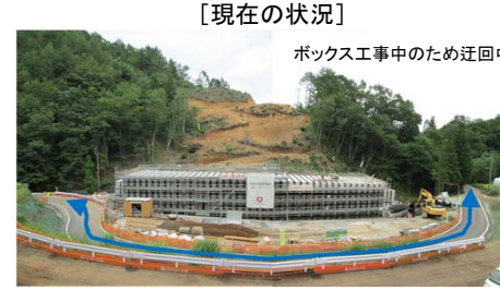
ボックス工事中のため迂回中。

現在、宮古市箱石地区(崎山第7地割)において、ボックスカルバートの工事のため市道箱石線の切り回しをしていましたが、ボックスカルバートの工事が概ね完了したため、 9月中旬頃に市道の切り替え工事 を行います。箱石地区付近をご通行の際は、スピードを出さず十分注意して走行するようお願いします。なお、工事完成までもう少しかかりますので、引き続き、工事へのご協力をお願いします。