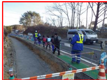
▲ 朝の集団登校誘導(椋内地区)