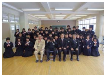
▲みんなで記念撮影しました。 (最後まで意志(石)を貫いて、がんばってね！)