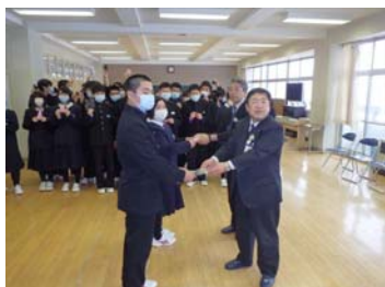
▲宮古市長、三陸国道事務所長から3学年の生徒代表に手渡されました。

田老第6トンネル工事では、高校入試を控えている田老第一中学校の3学年の生徒43名に対し、入試のお守り(合格祈願)として、田老第6トンネルで採取した貫通石を贈呈しました。