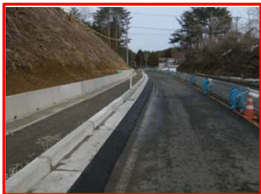
▲ (10号) 歩道設置(擁壁・側溝設置)

工事場所: 岩手県宮古市愛宕～田老 地内 工期: 平成25年3月6日～平成26年3月25日 工事内容: 舗装補修 L=3,300m、第9号工事用道路 L=115m、第10号工事用道路L=200m、第11号工事用道路 L=115m