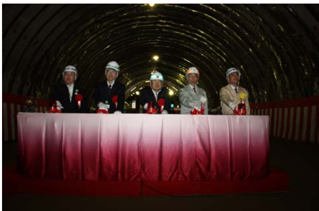
▲貫通発破により無事に貫通しました。

トンネル工事事故もなく、約7ヶ月の貫通となりましたが、これも、用地関係者をはじめとする地域の皆様、宮古市をはじめとする関係機関の皆様のご理解とご協力のおかげです。誠に感謝申し上げます。