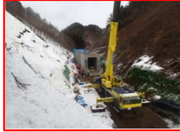
▲ プレキャストカルバート設置状況