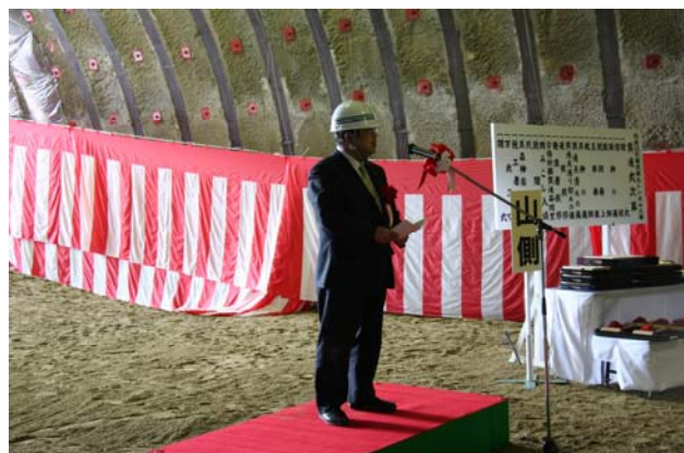
▲来賓を代表して宮古市長より挨拶を頂戴しました。