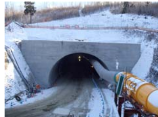
▲ 久慈側(北側)のトンネル入口坑門工完了