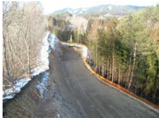
▲ 乙部野地区工事用道路新設状況