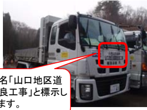
工事名「山口地区道路改良工事」と標示しています。

現在、宮古市山口5丁目地内から県道40号(宮古岩泉線)～国道106号線～国道45号線を走行し椗内及び青野滝へ土砂を運搬中です。市街地におきましては、振動対策の一環として「低速走行」で実走しております。工事期間中は、近隣住民の皆様には大変御迷惑をお掛けしておりますが、引き続き工事へのご理解とご協力をお願い致します。