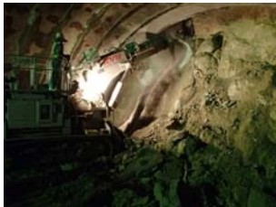
▲ ブームヘッダーによるトンネル掘削状況

工事場所：岩手県宮古市田老重津部 地内 工期：平成25年3月23日～平成26年3月28日 工事内容：トンネル掘削 294m、覆工294m、インパート294m、坑門工2箇所 坑内付帯工 1式、