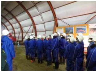
▲トンネルの中を見学している様子

田老第6トンネル工事では、1/22(水)に田老第一中学校の1～2学年61人を対象に、現場見学会を開催しました。身近なところでトンネル工事が進んでいる様子が伝わったかな～。