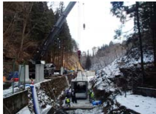
▲ 館が森地区 河川整備状況

工事場所：岩手県宮古市田老ケラス～乙部野 地内 工期：平成25年7月12日～平成26年3月31日 工事内容：道路土工 22,000m 3 、法面工5,400m 2 、カルバート工2基、排水構造物工 1式