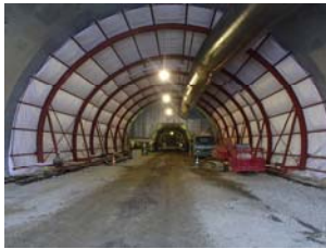
▲ 覆工コンクリート養生状況のトンネル坑内