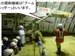
この掘削機械は「ブームヘッダー」といいます。