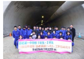
▲みんなで記念撮影しました