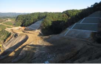
▲ 千徳浄化センター横北側の状況