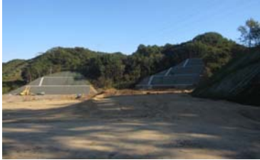
▲ 千徳 宮古道路横の状況

工事場所: 岩手県宮古市千徳 地内 工 期: 平成25年3月15日～平成26年1月17日 工事内容: 道路土工 200,000m 3 、法面工11,000m 2 、カルバート工3基、排水構造物工 1式