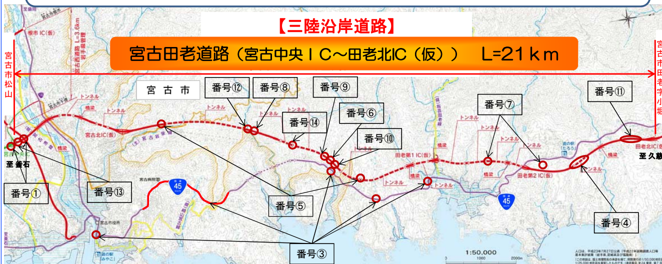
<平成25年度 宮古田老道路 工事一覧表>

宮古田老道路安全協議会では、宮古田老道路の一日も早い完成を目指し、以下の13工事が進行中です。地域の皆様にはご迷惑をおかけしますが、工事へのご理解とご協力をお願いいたします。