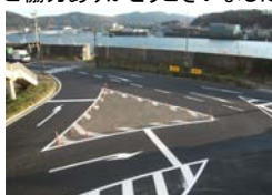
<完成後>愛宕交差点

・国道45号松月地区、椋内地区、田老第3地割地区の一部区間において上り線側の路肩を拡幅し、センターラインを変更する工事を行いますので、ご通行の際は、ご注意ください。