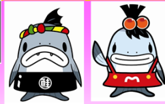
サーモンくん みやこちゃん