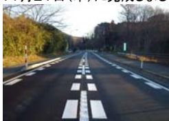
<完成後>佐原～崎山地区

・国道45号宮古市佐原～崎山地区、愛宕交差点の舗装工事が11月21日(木)に完成しました。ご協力ありがとうございました。