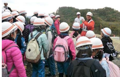
事業概要の説明の様子