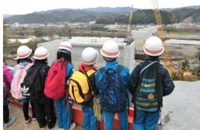
(仮)閉伊川橋下部工の見学