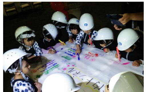
防水シートへ寄せ書きをしてもらいました