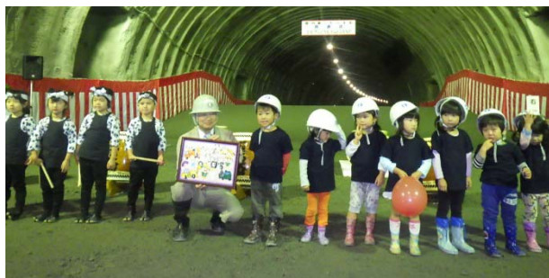
児童の皆さんから応援メッセージをいただきました