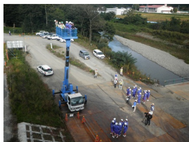
高所作業車に搭乗。10mの高さへ。