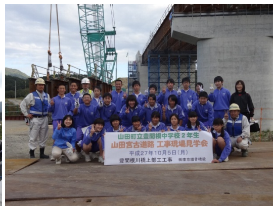
豊間根中学校2年生のみなさん