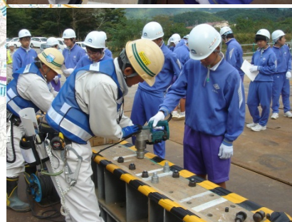
ボルト締付け体験