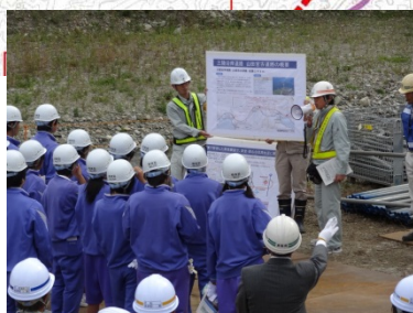
工事についての説明