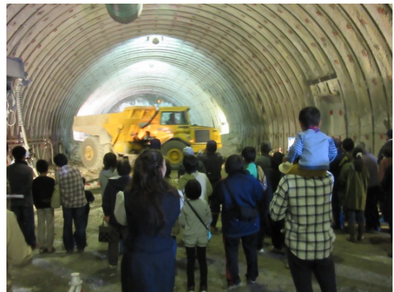
▲重ダンプのデモンストレーション走行

切羽（トンネルの掘削している最先端のところ）付近では、重ダンプのデモンストレーション走行が行われ、大きなダンプが狭い坑内をスムーズに旋回する様子を皆さん興味深く見ていました。終了後には一同から運転手さんに大きな拍手が送られ、大盛況のうちに見学会は終了しました。