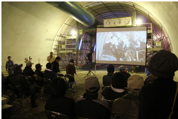
▲施工手順のビデオ上映

見学会は全てトンネル坑内で行われ、新小本トンネルの施工状況を撮影したビデオ上映や現場で実際に使用しているトンネル機械の展示なども行いました。