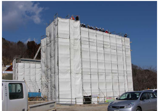
▲跨線橋の橋台（高さ15m）に登って工事が着実に進んでいる様子を一望