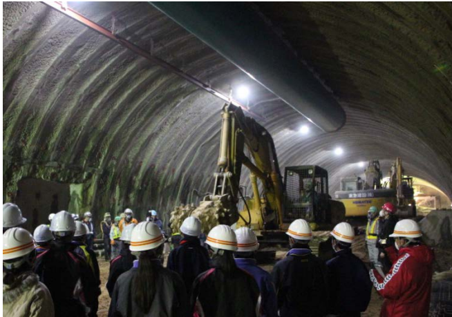
▲トンネル掘削機械が実際に動く様子を間近に見て興奮していました！