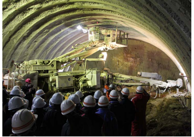
▲トンネル最深部（337m地点）でトンネル工事について説明