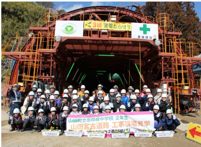
▲豊間根トンネル南側坑口で記念撮影 ありがとう！また来てね！

参加した生徒の皆さんからは、 Q：トンネルの大きさはどれくらいですか？ A：幅15m、高さ8.5mです。 など積極的に質問があり、トンネル工事に関心を深めた様子で、大変有意義な見学会となりました。