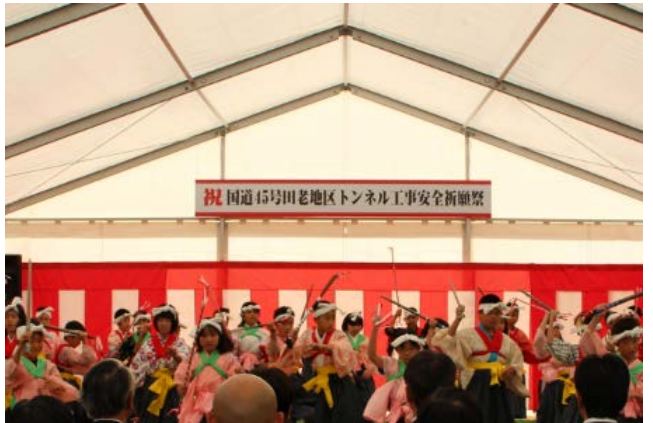
▲田老第一小学校4年生児童の皆さんが 「末前神楽七つ物」で激励してくださいました