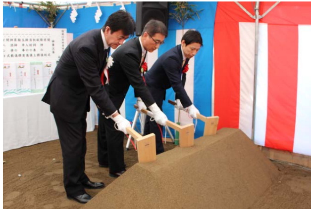
▲工事の安全を祈願して 関係者による鍬入れが行われました