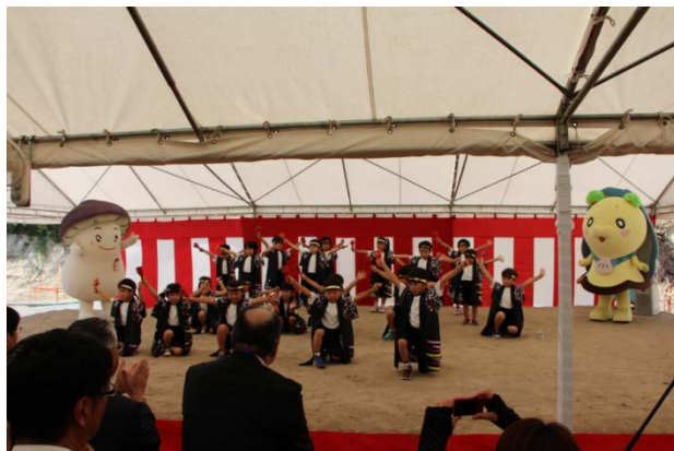
▲豊間根保育園の園児の皆さんが「よさこいソーラン」を披露して 激励していただきました