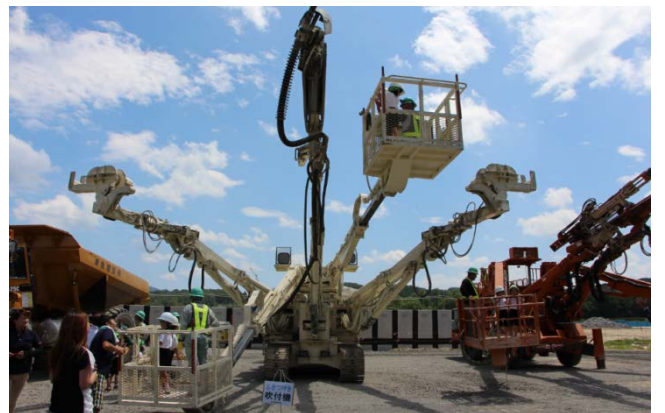
▲トンネル工事で活躍する大型機械に 試乗して、園児の皆さんは大興奮でした！ また見学に来てね！