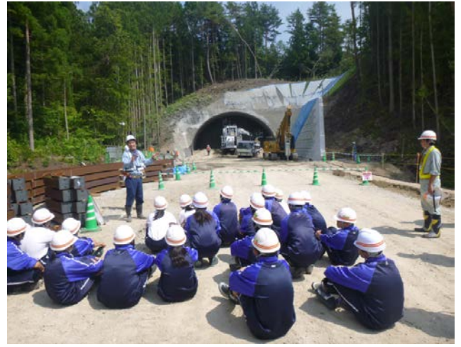
▲山田第2トンネル（仮称）の北側坑口 ここから機械を使って掘り始めます