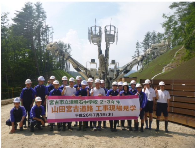
▲トンネル工事の大型機械をバックに記念撮影 ありがとう！また来てね！

参加した生徒の皆さんからは、 ・道路のつくり方を聞いておどろきました ・トンネル工事の機械に興味を持ちました ・少しずつ復興が進んでいることを実感しました などの感想をいただきました。 どうもありがとうございました。