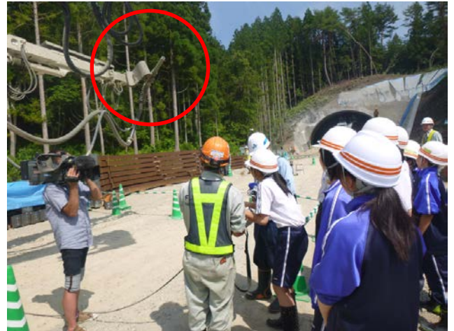
▲ノズルの向きや角度を一生懸命動かして、初めて触れる機械にみんな喜んでいました！