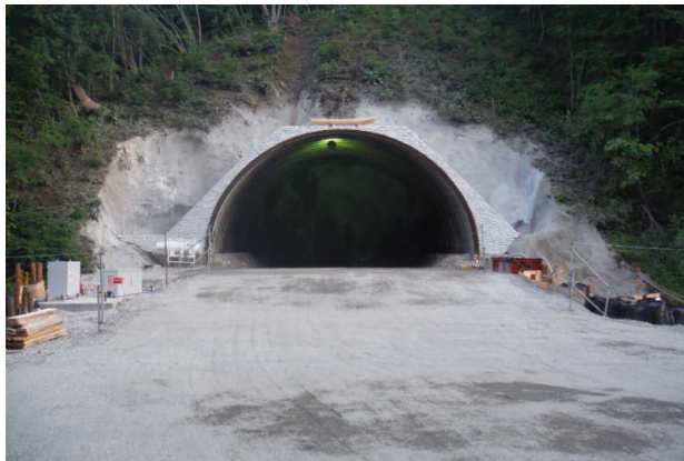
▲榎内第1トンネル北側坑口 ここから本格的に掘削工事が始まります

トンネルの重要性を肝に銘じ、技術の総力を結集し、高品質で安全なトンネルを無事故で完成させるべく力を尽くして参ります。