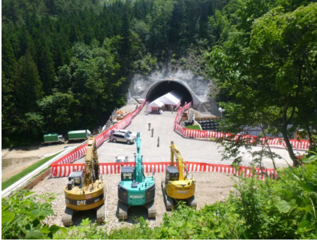
▲安全祈願祭の式典会場 榎内第1トンネル北側坑口