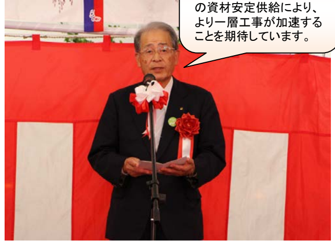
▲宮古市長よりご挨拶 (山口公正副市長代読)

高速交通ネットワークは、復興の加速に必要な不可欠です。公共プラントからの資材安定供給により、より一層工事が加速することを期待しています。