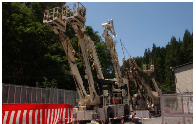
▲これらの大型機械や高い技術力を駆使し 無事故で一日も早い開通を目指します