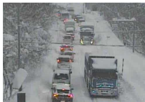
【写①】R3.12.27 国道4号の交通混雑状況