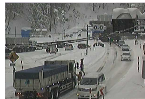
【写④】R3.12.28 国道13号の交通混雑状況