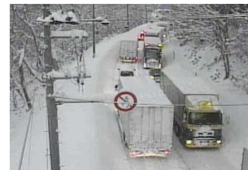
【写②】R3.12.28 国道7号の交通混雑状況