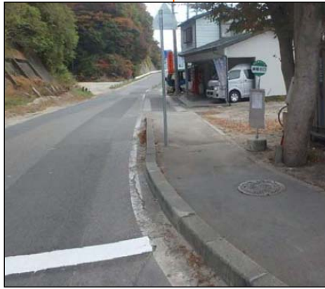
【津軽石口】 上り・下り線に1基ずつ 設置します。