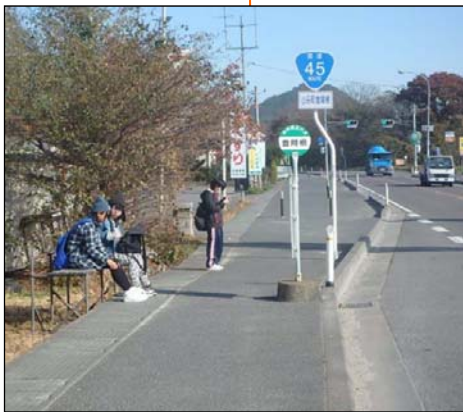
【豊間根】 老朽化した既設ベンチを撤去し 2基設置します