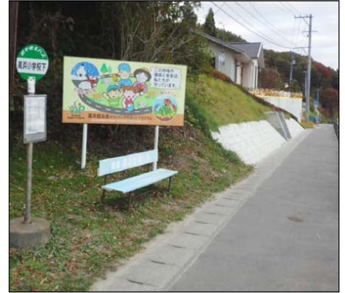
【高浜小学校下】 既設ベンチの隣に 1基設置します