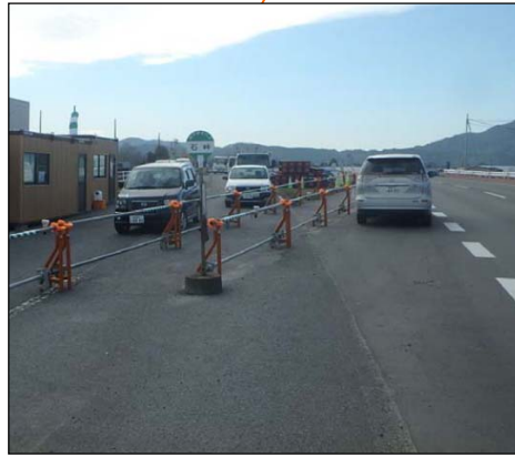
【石岐】 1基設置します