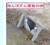
田んぼダム堰板の例