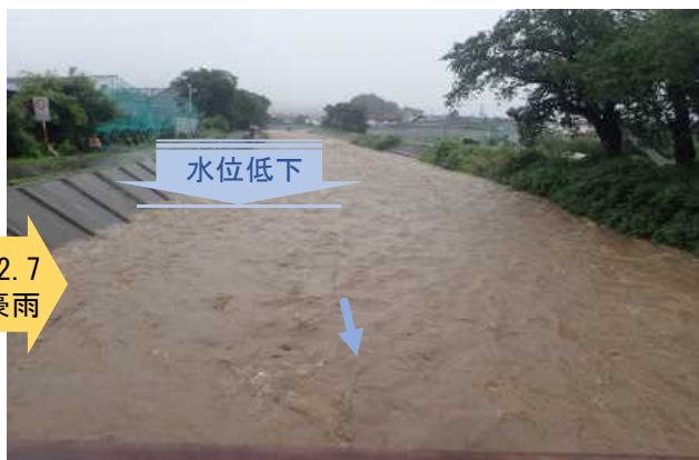
▲ ①河川流下能力向上対策の効果事例

①河川流下能力向上対策 ・河川の流下能力を確保するための堆積土砂の浚渫、支障木の伐採