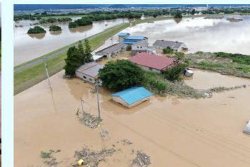
R2.7月豪雨におけるポンプ場冠水状況