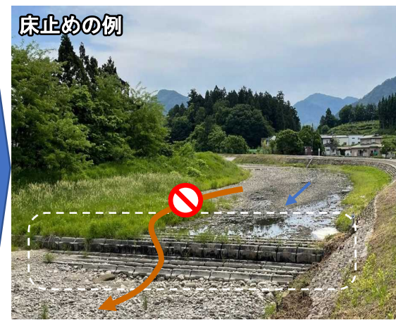
▲ ②流路保全対策（床止め）の対策後イメージ ▲