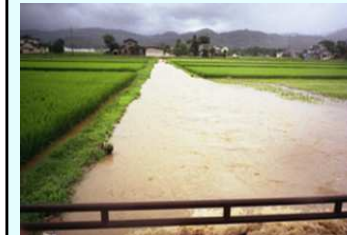
豪雨による洪水ピーク時の排水路の溢水状況