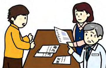
②不明な点は 市町村に相談