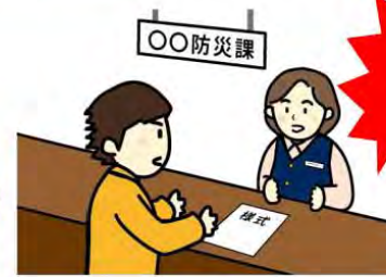
③市町村へ提出 (コピー可)