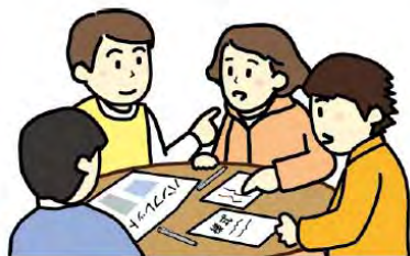
①作成支援編を見ながら 様式を記載