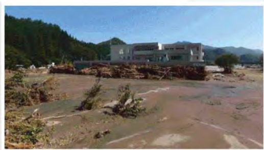
平成28年台風第10号による被害状況