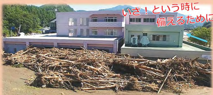
写真：平成28年台風10号要配慮者利用施設被災状況 岩手県岩泉町