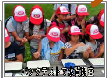
バックテストで水質調査