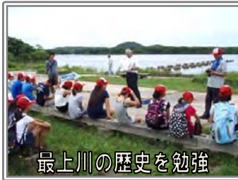
最上川の歴史を勉強