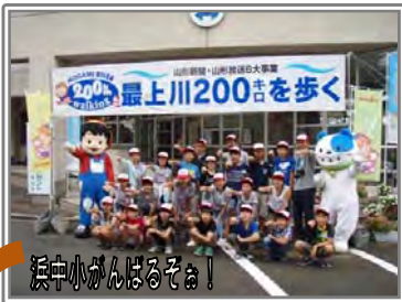
浜中小がんばるぞー！

最終週となったこの日は、県企業局の工業用水取水口で河川水の浄化について説明を受けたり、スワンパークでゲストティーチャーからお話を聞いたり、普段接することのない最上川の働きや歴史などに、興味津々でした。