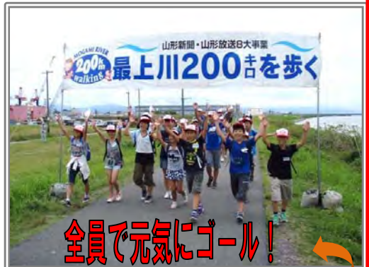
全員で元気にゴール！

7月20日(土)、今年で12回目となった山形新聞社主催の「最上川200キロを歩く 小学校探索リレー」が、酒田市立浜中小学校5、6年生20名が参加し、庄内橋から最上川河口までの間で行われました。