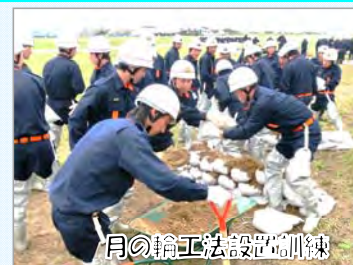
月の輪工法設置訓練

当日は、総勢258名の水防団員の参加により、平成25年7月出水時に実施した月の輪工法や釜段工法を含め4つの水防工法を設置する訓練を行い、出水時における現場での対応について確認しました。