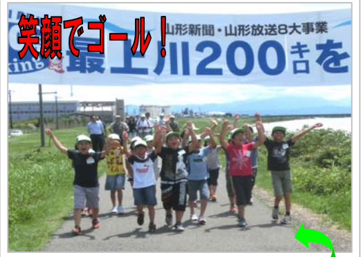
笑顔でゴール! 山形新聞・山形放送8大事業 最上川200キロを