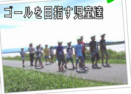
ゴールを目指す児童達