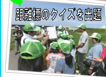
距離標のクイズを出題