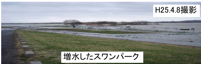
増水したスワンパーク

今後も大雨に伴い増水する恐れがあります。増水した河川は危険ですので近づかないようお願いします。