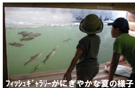
フィッシュギャラリーがにぎやかな夏の様子