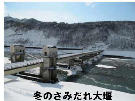
冬のさみだれ大堰