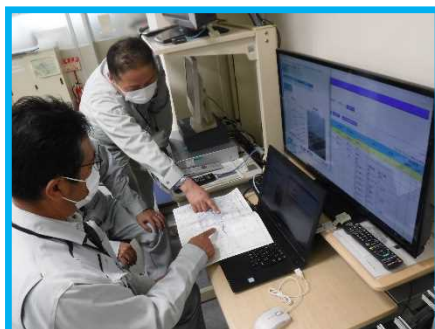
現場からの点検報告状況確認

上記で紹介した維持工事では、出水時や大規模な地震が発生した後に堤防や樋門・樋管などの河川管理施設が損傷を受けていないか、確認を行うため、状況把握業務も行っております。4月26日、出張所職員、受注者(長浜建設(株))と合同でシステム使用方法や現場での確認方法などの訓練を行いました。最近、地震や大雨が頻繁に発生しております。本番が無いことを祈りますが、今回の訓練での反省点は実際の業務に役立てていきたいと考えております。