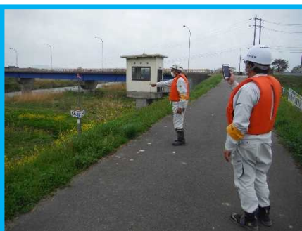
出水時を想定した現場確認訓練