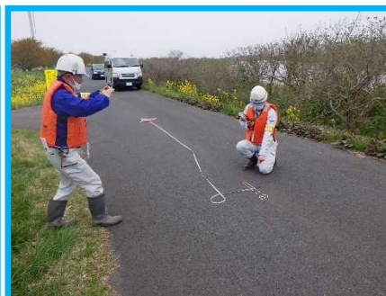
地震時を想定した現場確認訓練