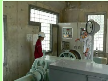
船通しゲート操作室