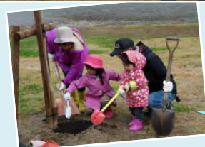
きれいな花を咲かせてね