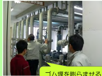
機械室 ゴム堰を膨らませるための空気を送ります

酒田第六中学校の生徒が、職場体験で酒田河川国道事務所の様々な業務を学びました。さみだれ大堰の操作など、飽海出張所ならではの業務に触れました。今回の体験が少しでも将来の目標のヒントになってくれればうれしいです。