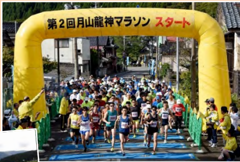
最上川の駐車場もいっぱい