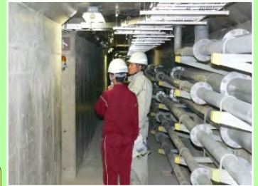
さみだれ大堰地下の監査廊