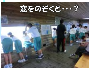
窓をのぞくと・・・？