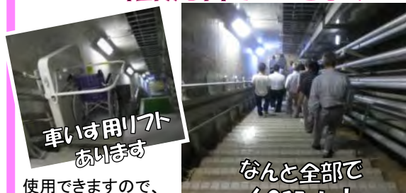
車いす用リフトがあります