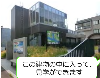
この建物の中に入って、見学ができます

※魚が通れる水路のこと。さみだれ大堰が起立中は川がせき止められるため、魚がここを通ります。