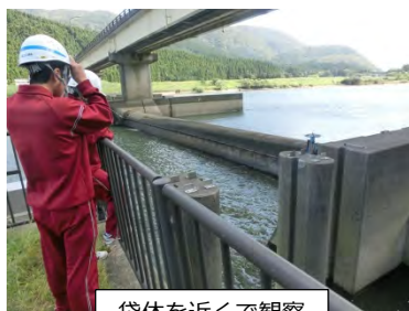
袋体を近くで観察

10月7日、酒田第六中学校2年生2名が、職場体験学習で飽海出張所を訪れました。さみだれ大堰のしくみを学んだり、普段は通ることができない監査廊(地下の点検通路)を通ったり、堰の操作を行ったりしました。ゴムの袋体は川の中にあるので、職員でもめったに見ることができませんが、この日は特別に間近で見ることができました。