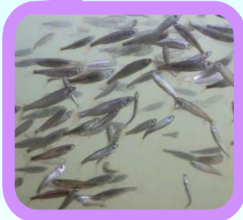
ウグイ&ニゴイの群れ