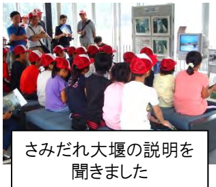
さみだれ大堰の説明を聞きました