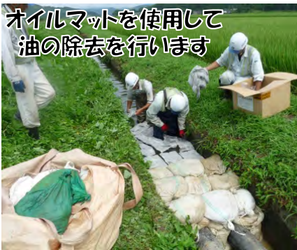
オイルマットを使用して油の除去を行います

8月6日に相沢川で軽油流出事故がありました。流出した油は側溝や水路を通して河川に流れてしまいます。河川に流れると、下流で取水している水道水や工業用水などに影響がでるため、オイルフェンスを設置したり吸着マットを使用したりして油の流出や拡散を防ぎます。その際の費用が 原因者負担 となることがあります。これから灯油を使用する季節を迎えますので、油の取扱いには十分に気をつけて下さい。