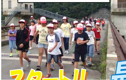
庄内町余目一小的の4～6年生のみなさん

飽海出張所は、庄内大橋から「白糸の滝」の下流までの最上川18.1kmと相沢川1.46km及び立谷沢川0.5kmと、さみだれ大堰の管理をしています。