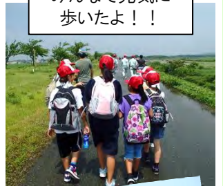
みんなで元気に歩いたよ!!