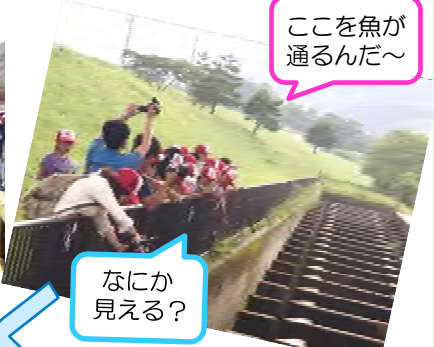
ここを魚が通るんだ～