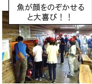
魚が顔をのぞかせると大喜び!!