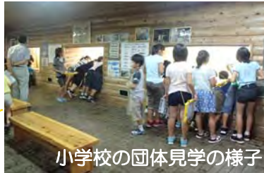
小学校の団体見学の様子

フィッシュギャラリーは、最上峡の下流に位置し、秋は紅葉がきれいです。遠足や行楽行事など、旅の途中にお立ち寄り下さい。