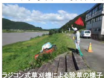
ラジコン式草刈機による除草の様子

堤防除草で発生した刈草を、無償で提供しています。家畜の飼料、堆肥等へいかがでしょうか？