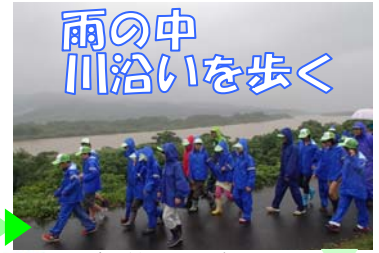
雨の中 川沿いを歩く