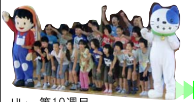
リレー第10週目。庄内町立余目第二小学校六年生のみなさん。

5月11日から7月20日までの毎週土曜日、最上川の上流から小学生がリレー形式でバトンをつなぎ河口を目指す「最上川200kmを歩く」が行われました。飽海出張所では、第10週目となる7月13日に管内の立沢川合流点から庄内橋までの川沿いを小学生達と一緒に歩きました。当日はあいにくの雨でしたが、子供達は元気いっぱいに行進していました。