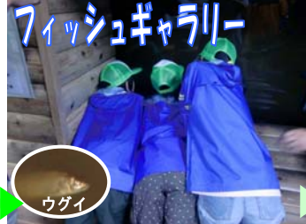
フィッシュギャラリー