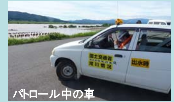
パトロール中の車