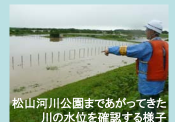
松山河川公園まであがってきた川の水位を確認の様子