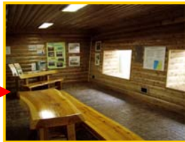
フィッシュギャラリーの様子