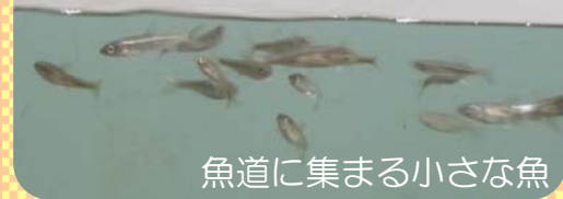
魚道に集まる小さな魚

さみだれ大堰を倒すと、魚道は、水の流れがなくなり小さな魚や、ゆったり泳ぐウグイの姿を観察することができます。また、最上峡の下流に位置するので秋は周辺の紅葉がキレイです。遠足、行楽行事など旅の途中にお立ち寄り下さい。