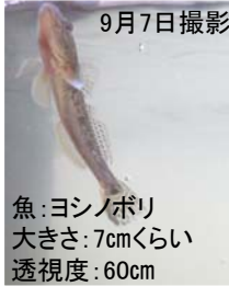
魚：ヨシノボリ 大きさ：7cmくらい 透視度：60cm