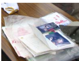
掘り起こしたタイムカプセルと中に入っていた手紙や写真