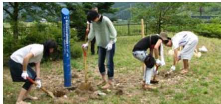
掘り起こしの様子