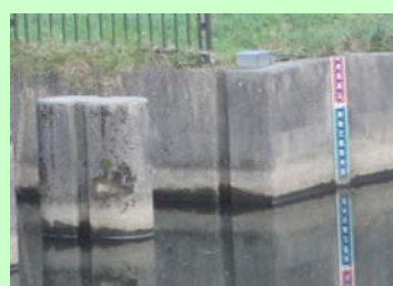
上流右岸魚道出口