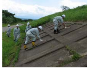
護岸コンクリートの点検