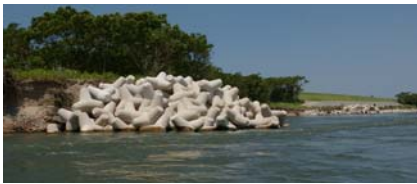
河岸の洗掘を防止する水制工の状況

6月26日、普段なかなか確認することができない護岸や橋の土台などを、ボートを使って、最上川を下りながら点検しました。