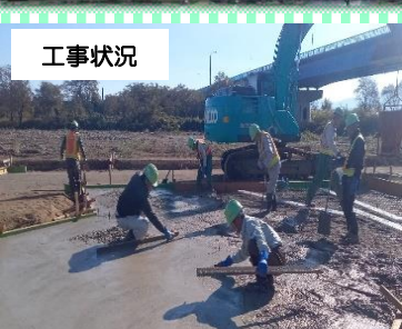
今年度整備した多目的広場とデイキャンプスペース