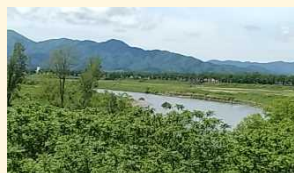
↑ 赤川右岸 樹木伐採前