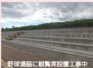
野球場脇に観覧席設置工事中

樹木伐採をすることにより河川景観（川が見える景観）が良くなります。また、 散策路の整備 も予定しています。川を見ながらお散歩はいかがでしょう。