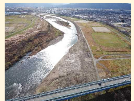
かわがよく見えるようになりました！