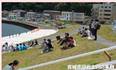
宮城県旧北上川の事例