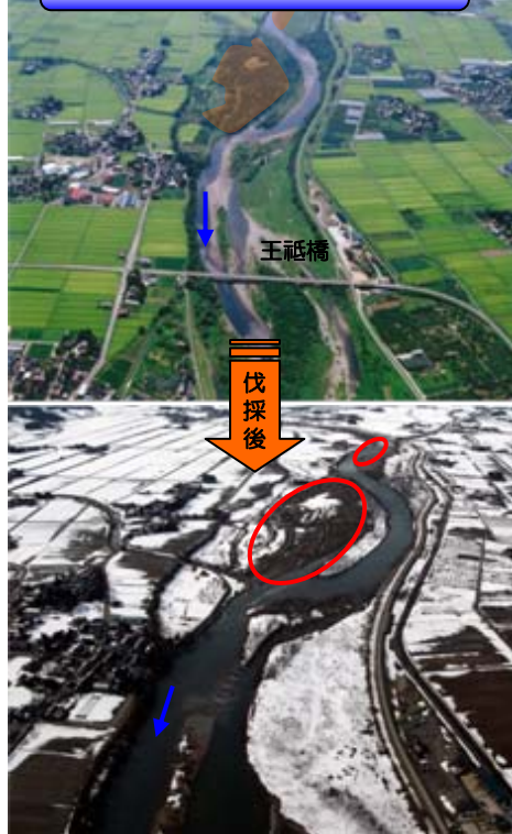
赤川黒川地区河道整正工事