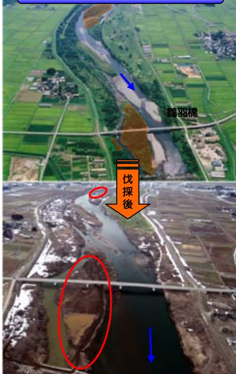
赤川勝福寺地区河道整正工事