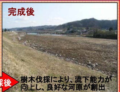
伐採後 樹木伐採により、流下能力が向上し、良好な河原が創出