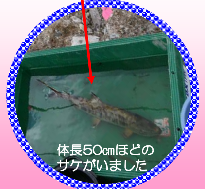
体長50cmほどの サケがいました