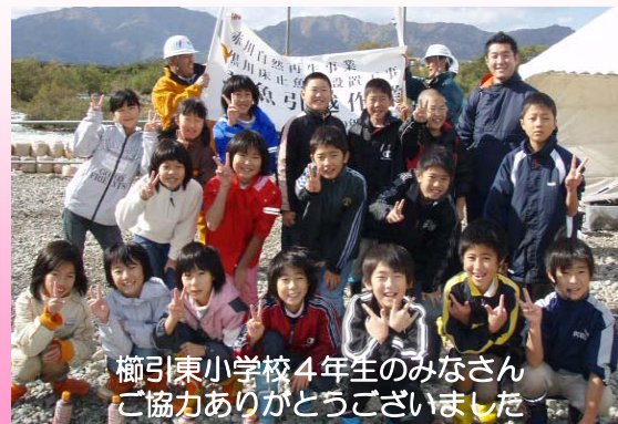
櫛引東小学校4年生のみなさん ご協力ありがとうございました