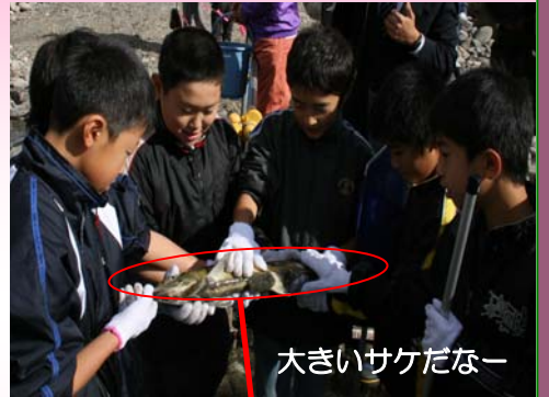
大きいサケだなー